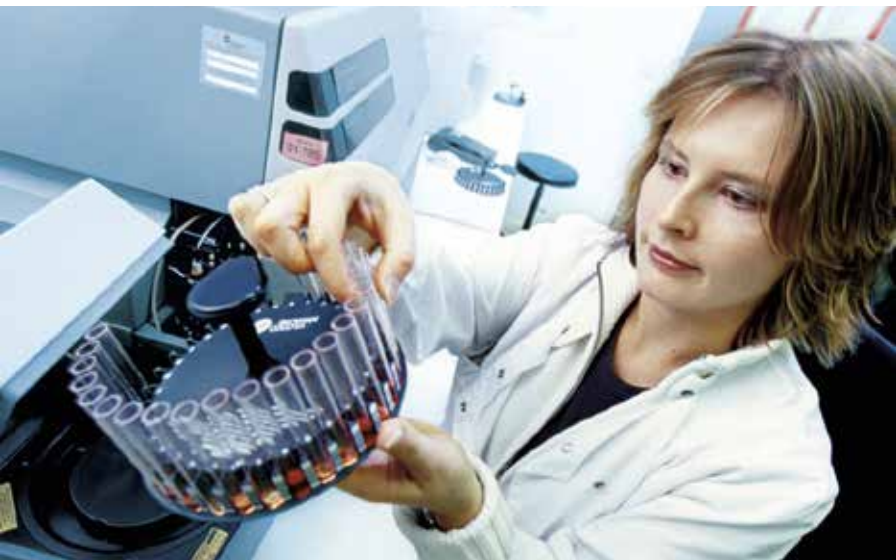
Cité des Métiers de Haute-Normandie