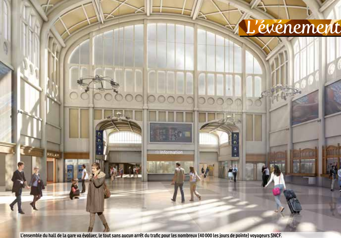
L'ensemble du hall de la gare va évoluer, le tout sans aucun arrêt du trafic pour les nombreux (40 000 les jours de pointe) voyageurs SNCF.