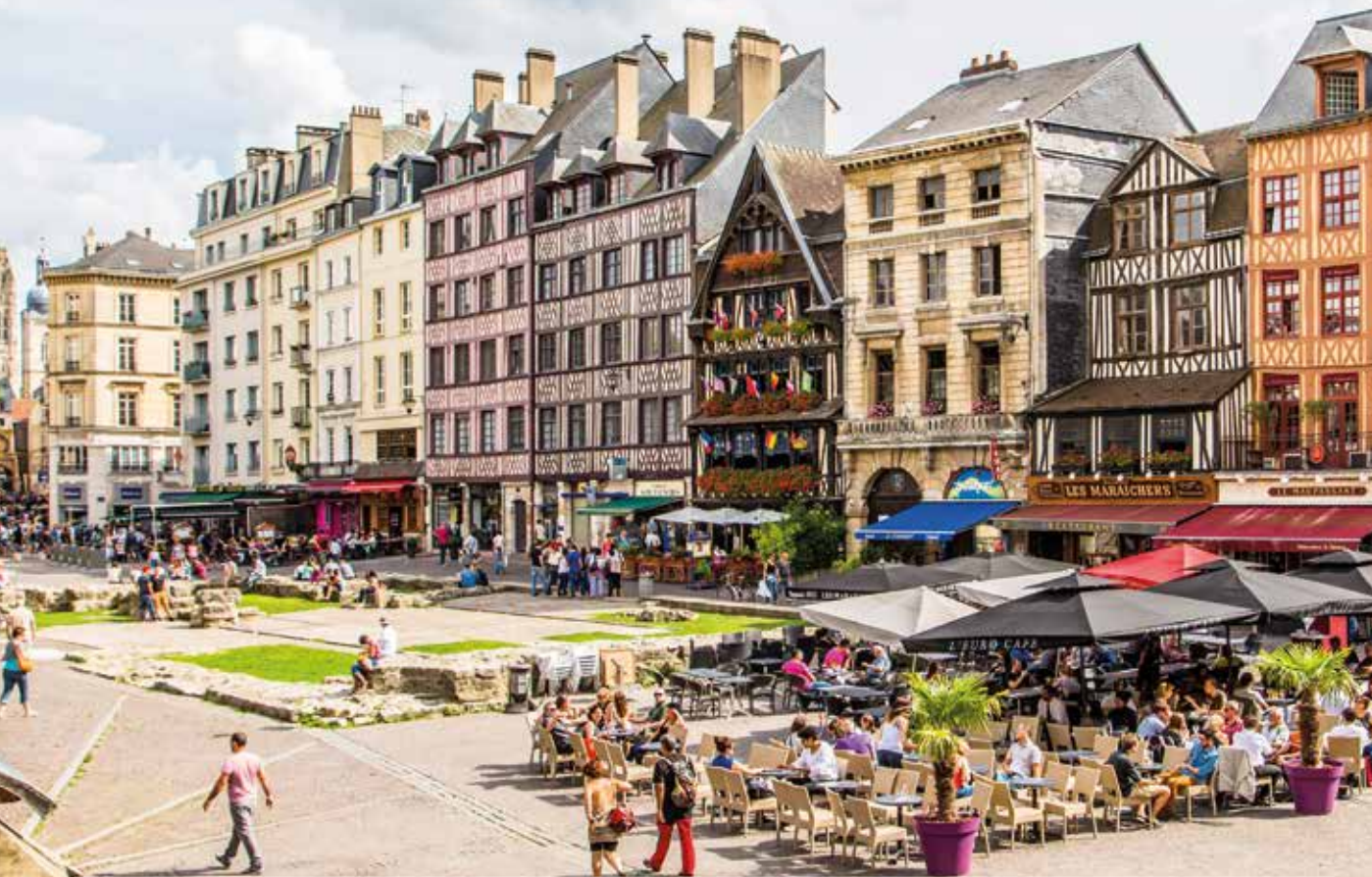
Avec le futur Office du commerce, la Ville souhaite confirmer la position incontournable de Rouen pour les enseignes commerciales.