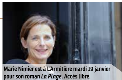
Marie Nimier est à L'Armitière mardi 19 janvier pour son roman La Plage . Accès libre.

► vendredi 29 janvier de 9 h à 12 h, de 14 h à 16 h • Centre André-Malraux