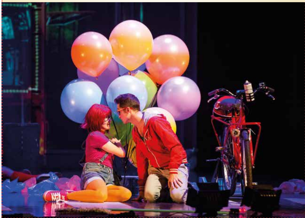
© L. Roda - Accademia Scala

► Milo et Maya • vendredi 15 janvier et samedi 16 janvier à 20 h et dimanche 17 janvier à 16 h • Théâtre des Arts • www.operaderouen.fr