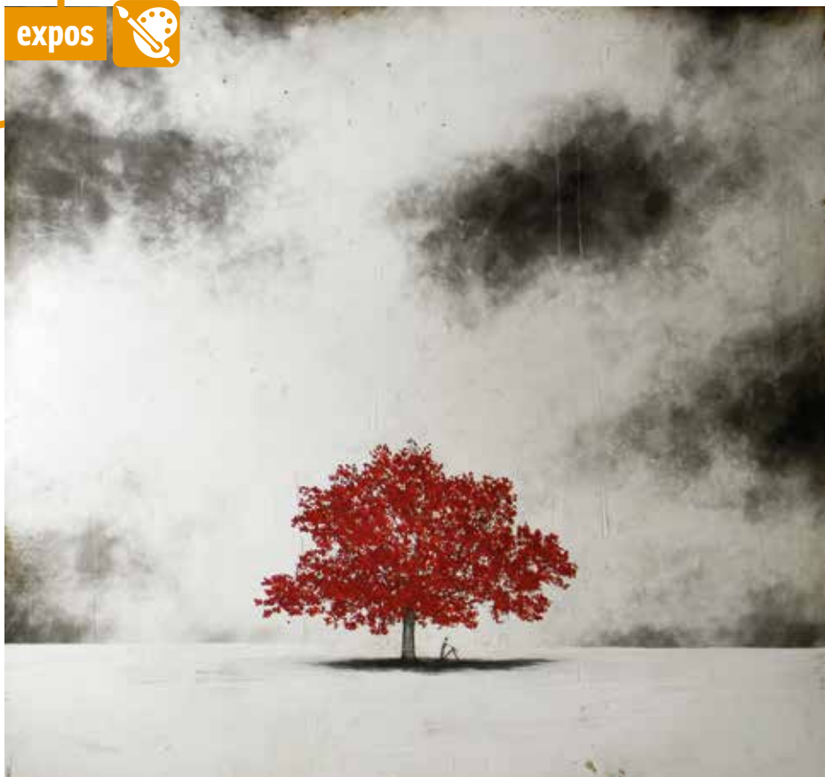
Les toiles d'Antoine Josse (ci-dessus À l'abri des satellites ) sont à voir à l'Espace de la Calende jusqu'au 6 février. Dans le même temps, Marc Touret expose ses sculptures.