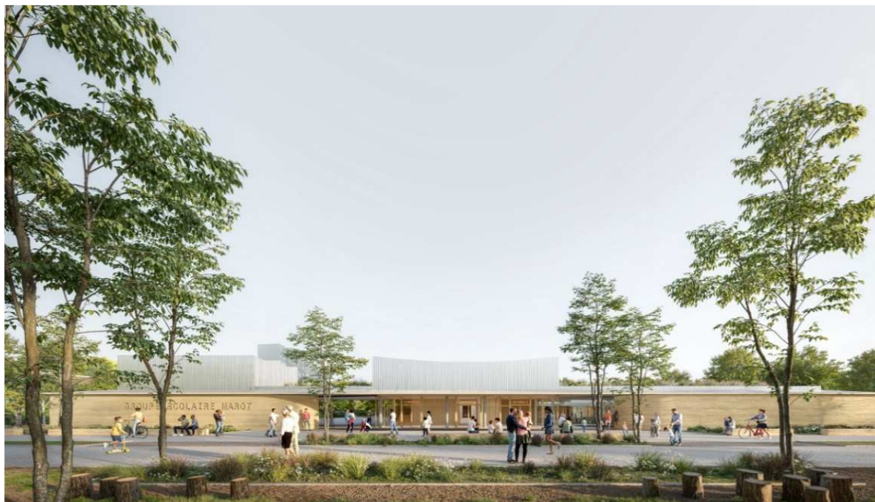
Perspective depuis le mail des écoles sur le parvis - Crédit : ACAU