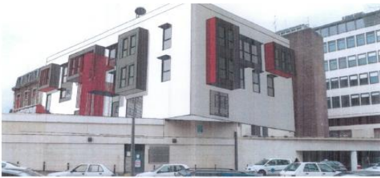
Pc6d - vue depuis rue d'Amiens