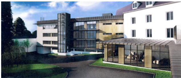
PC6 b - vue depuis le parking intérieur