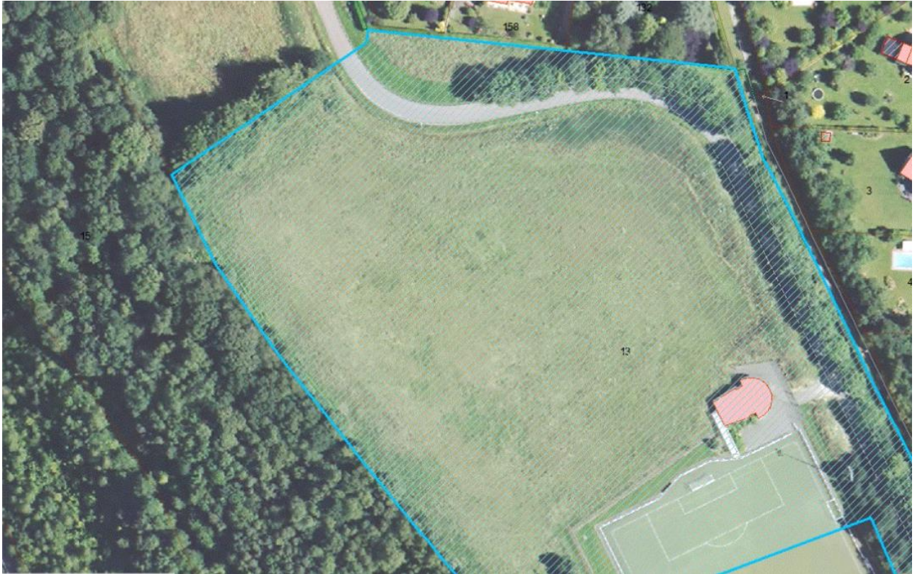
Annexe 2 : plan de gestion de la parcelle expérimentale