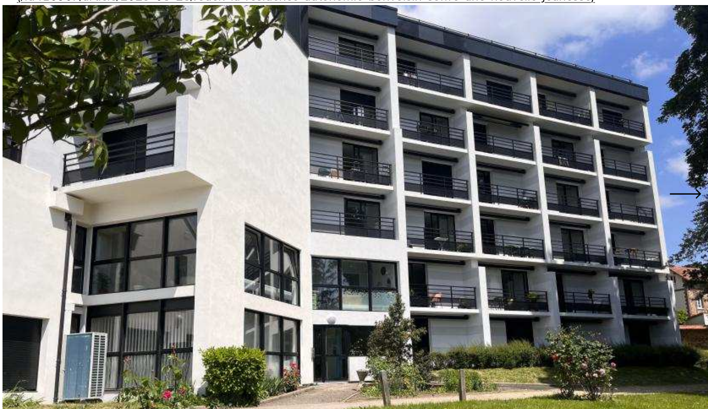
La nouvelle façade de la résidence Bonvoisin - PND

(/id416967/article/2023-05-25/rouen-la-residence-autonomie-bonvoisin-soffre-une-nouvelle-jeunesse)