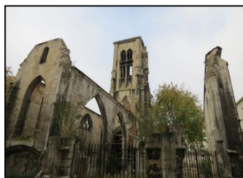
Saint-Pierre du Chatel.