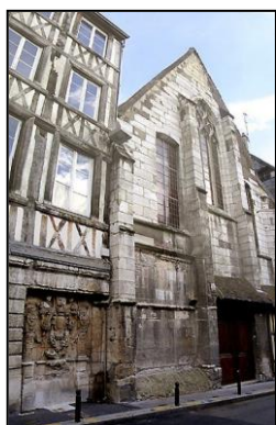
Sainte-Croix des Pelletiers.