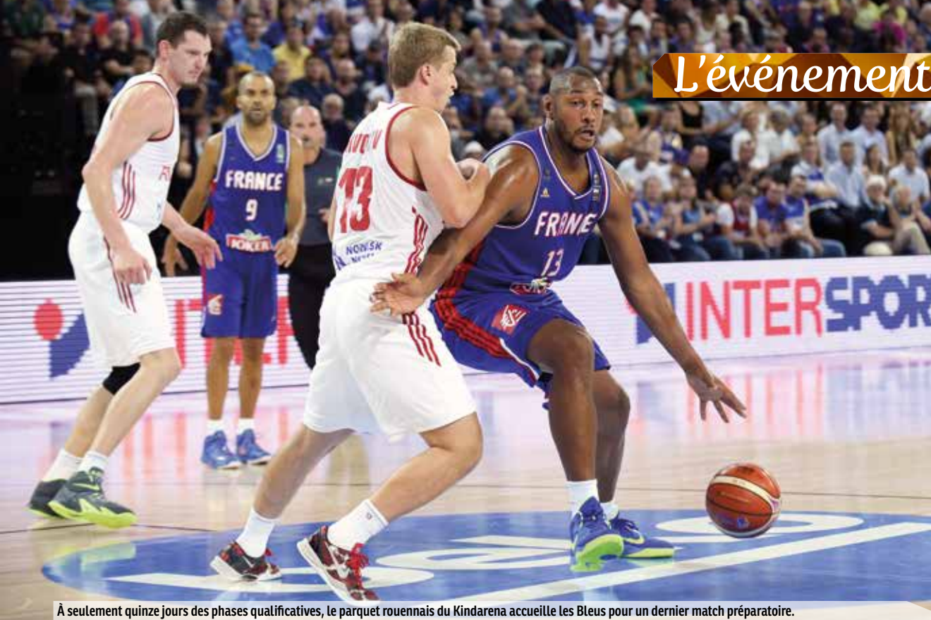
À seulement quinze jours des phases qualificatives, le parquet rouennais du Kindarena accueille les Bleus pour un dernier match préparatoire.