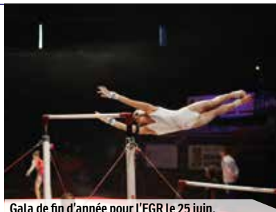
Gala de fin d'année pour l'EGR le 25 juin.

Animation Partie de foot • à l'occasion de l'Euro 2016 • diffusion des matches en direct sur les terrasses des restaurants du parvis