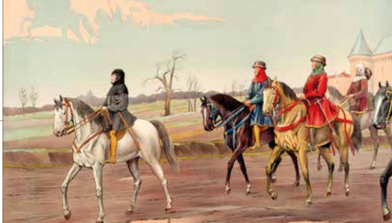
Toute la lumière est sur Jeanne au Musée de l'Éducation et à l'Historial mercredi 8 juin.