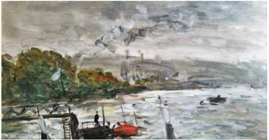
Les toiles de Jean-Jacques René sont à voir à l'Atelier des Arts jusqu'au 31 juillet.

Mouvements du flou • Normandie Impressionniste • vernissage le 15 juin à 16 h • du mardi au samedi, de 14 h à 17 h