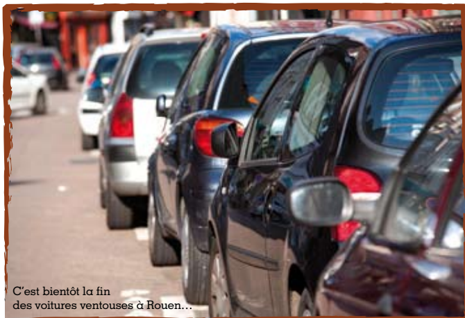
C'est bientôt la fin des voitures ventouses à Rouen...