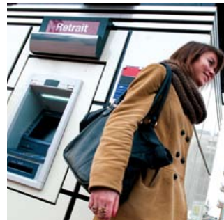
Depuis février, un distributeur automatique de billets est installé dans l'Île Lacroix, rue Jacques-Chastellain.