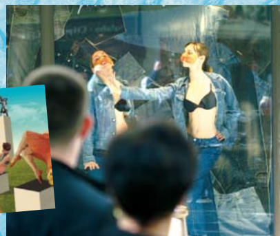
Spectacle de danse dans les vitrines