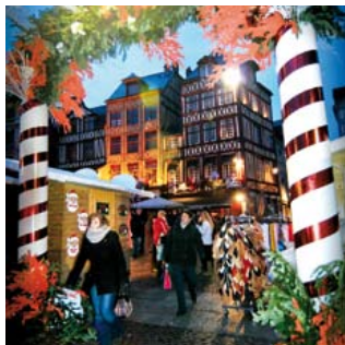
Fête et fantaisie... l'esprit de Rouen Givrée a encore soufflé cet hiver, spécialement dans le quartier Vieux-Marché où le marché de Noël a élu domicile.