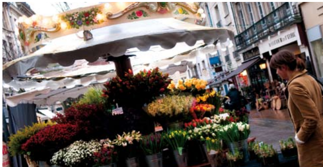
Un kiosque à fleurs a écloé à l'intersection de la rue et de la place des Carmes.