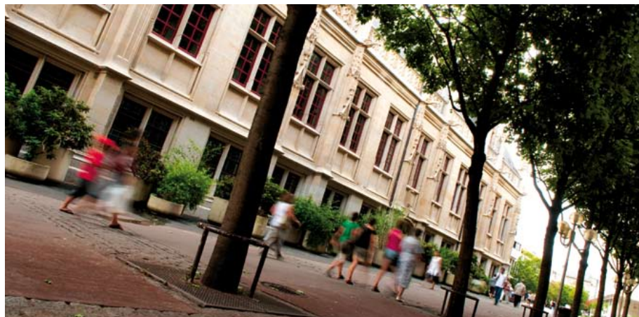
La rue Eugène-Boudin sera réaménagée à partir de fin 2011