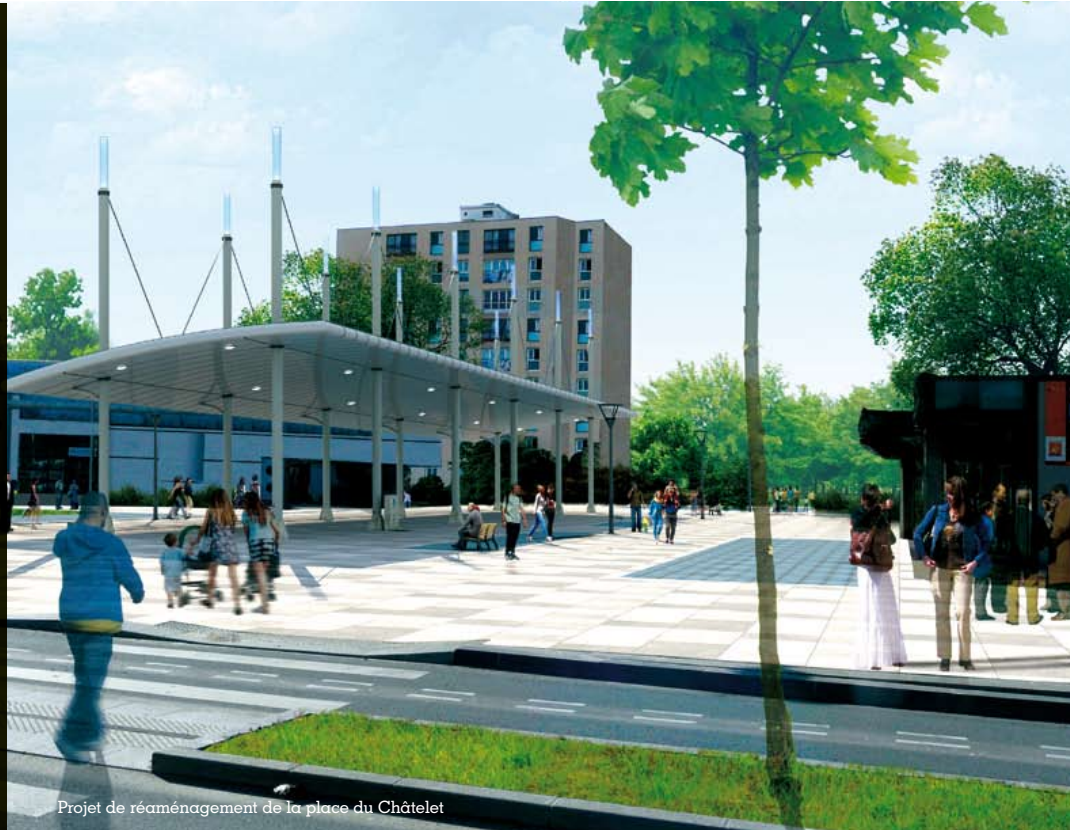
Projet de réaménagement de la place du Châtelet