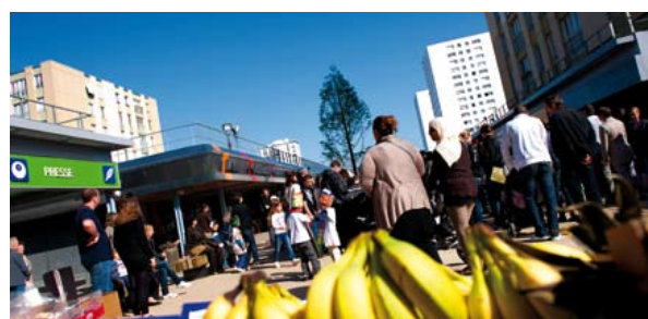
Le centre commercial de la Grand'Mare rénovée