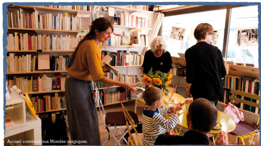
Accueil convivial aux Mondes magiques.

propres ailes. Pour préparer cet envol dans les meilleures conditions, ils ont eu recours à l'accompagnement du CRIJ via le programme ICA. Ils s'expliquent ci-dessous. ■