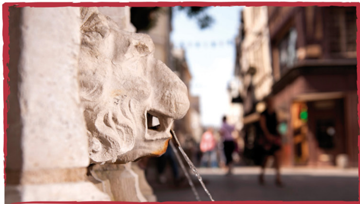
Fin du XV e siècle, une fontaine est installée au carrefour de la Crosse pour distribuer l'eau de la source Galaor.

Celles-ci ne sont pourtant pas très loin. De grandes enseignes comme Zara ou Mango se sont installées rues des Carmes, attirées par le flux de passants. « C'est le carré magique, rappelle Guy Pessiot, beaucoup de commerçants souhaitent s'implanter dans ces rues, et il n'y a pas beaucoup de turn over. L'attente est parfois longue pour eux. » Elle vaut la peine : les deux parkings à proximité - Hôtel de Ville et Espace du Palais -, le réaménagement récent du quartier, la réfection des vitrines grâce au plan Fisac initié par la Ville ont eux aussi contribué à l'attraction de ces jolies rues. ■