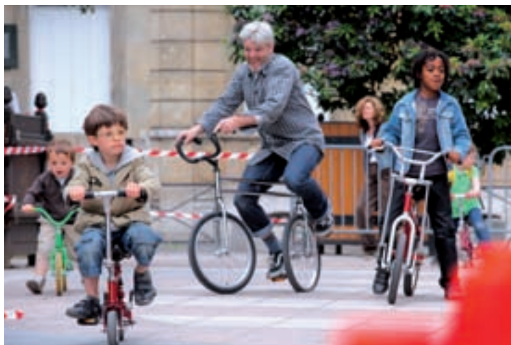
La fête du Vélo s'adresse à toutes les roues et roulettes, des petites aux plus grandes.

Fête du Vélo et de la Biodiversité • Samedi 12 juin • De 14 h 30 à 18 h 30 • Hôtel de Ville • Vélo parade à 13 h 15 sur le parvis • Concert de reggae à 19 h dans les jardins • Accès libre