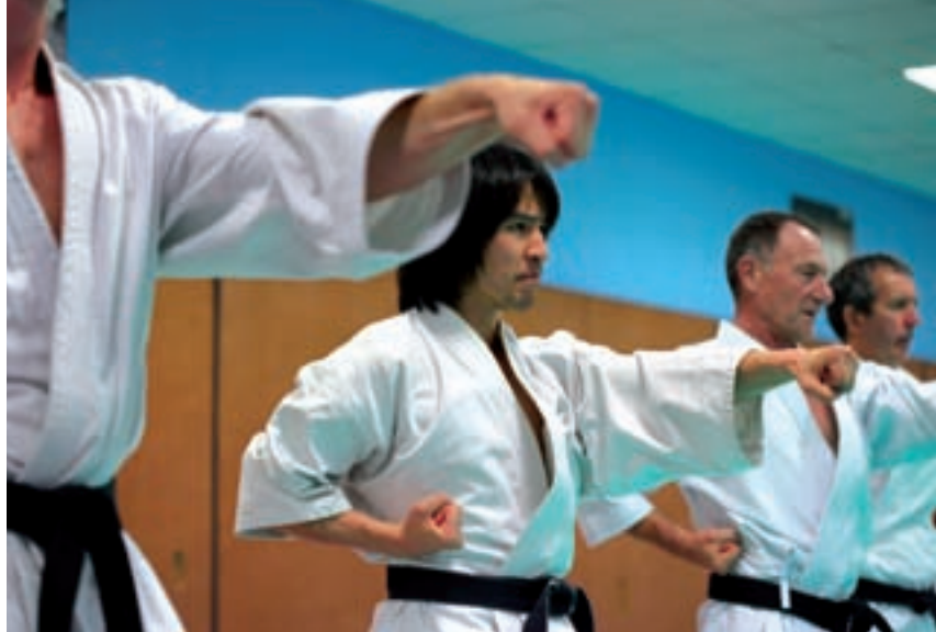
Grâce à Ferrero, le KCR peut développer son projet en direction des enfants en difficulté.