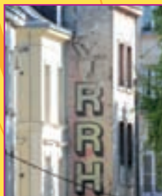
Réponse du n° 331 : Ornement de façade, 29 place de la Cathédrale