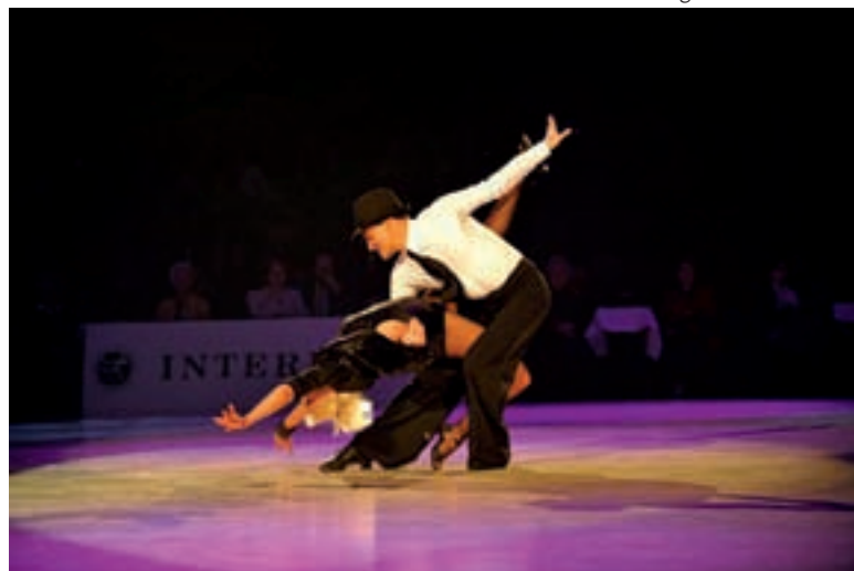
La danse fait son show, le samedi 12 juin, au Zénith.

Tous les détails vous seront alors communiqués. Rock, pop, électro, chanson française, hip-hop... Tous les talents sont les bienvenus.