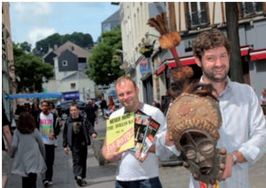
Du 17 au 19 juin, la rue Cauchoise vit au rythme de l'opération « Culture en fête ».