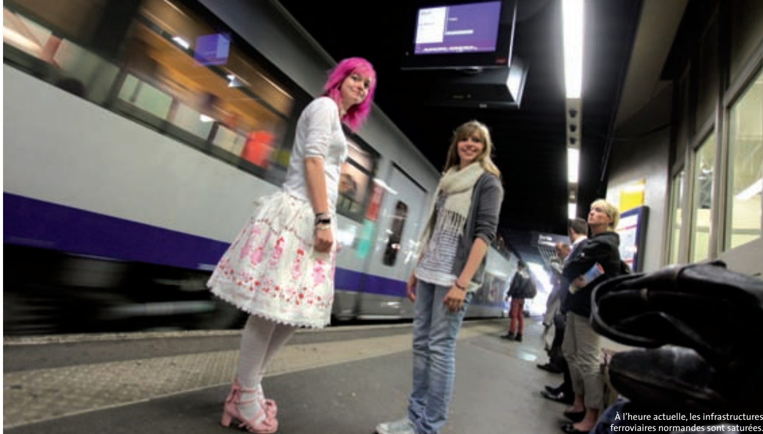
À l'heure actuelle, les infrastructures ferroviaires normandes sont saturées.