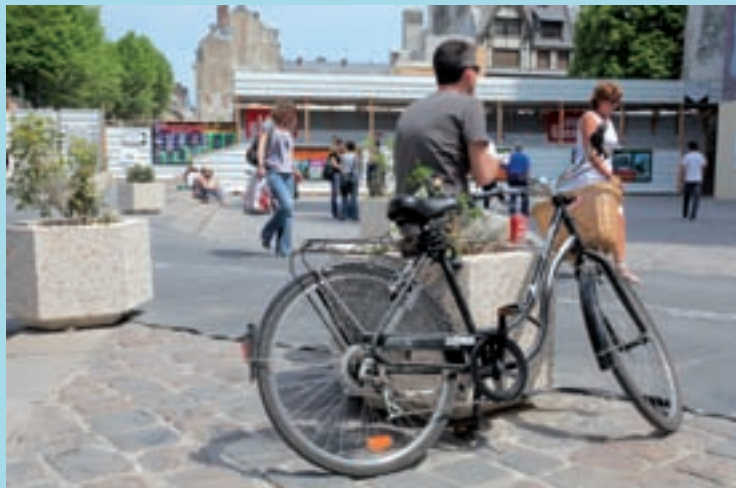
Le schéma du 3 e plan vélo sera dévoilé en réunion publique le 17 juin, à l'Hôtel de Ville.

Réunion publique • Jeudi 17 juin, 18 h • Hôtel de Ville, salle des mariages • Entrée libre