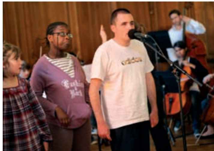
Les 12 enfants du CNL et 80 musiciens du Conservatoire donnent un concert le 10 juin.