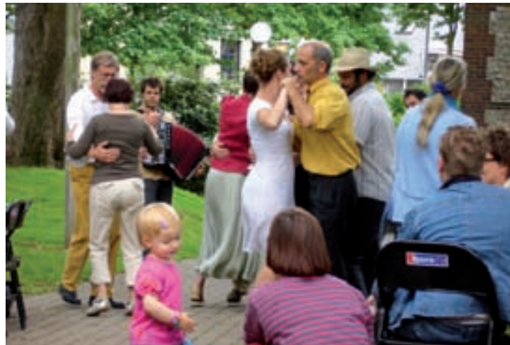
Après le repas, place à la danse sur des airs et des chansons de barbillon américain.

Repas du quartier Village-Croix-de-Pierre • À partir de 12 h • Square Marcel-Halbout, entrée rue Legouy