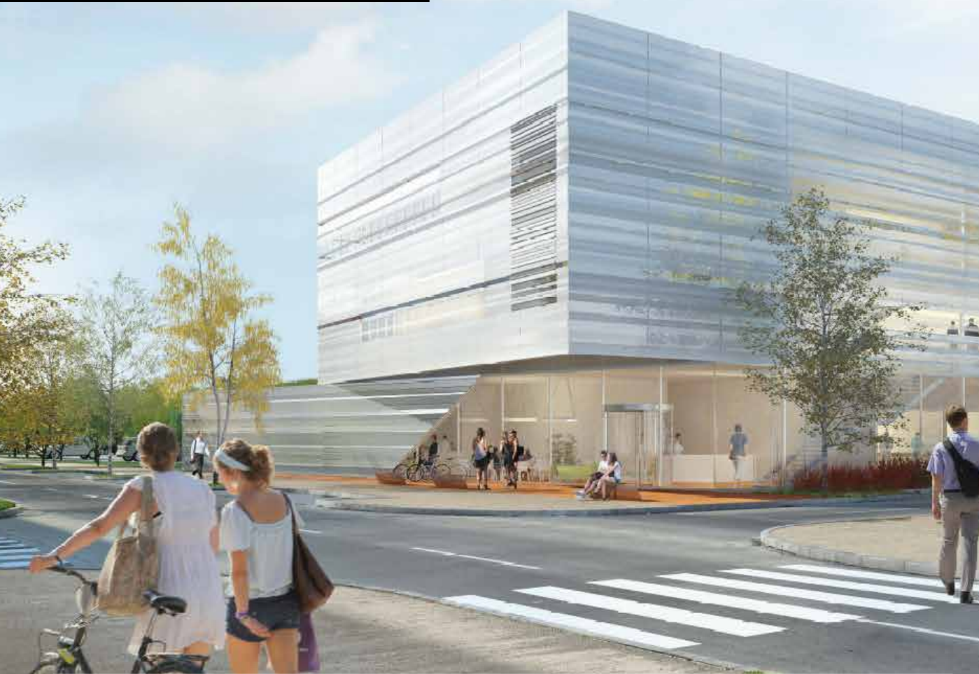
Le visage du prochain « Medical training center », équipement qui place Rouen en pole position de la formation des professionnels de santé.