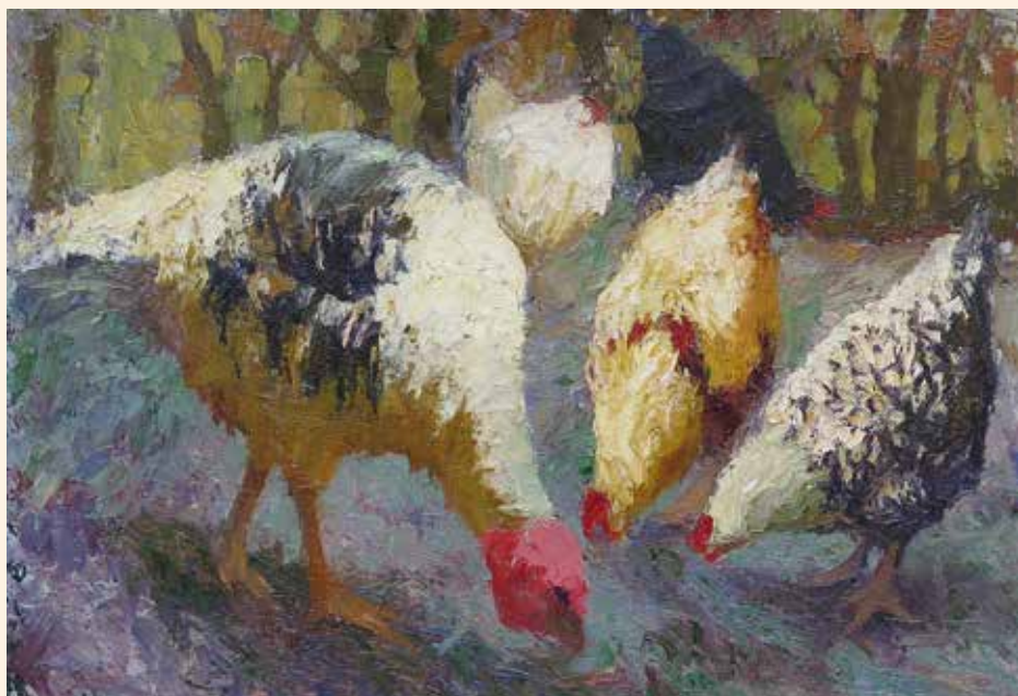
Hommage à Marcel Couchaux, à la Galerie Bertran. À voir du 25 septembre au 7 novembre.

► du 26 septembre au 22 mai • Panorama XXL