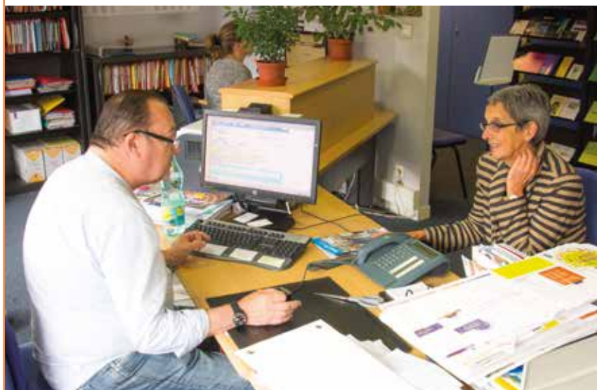
Écoute et conseil aux associations, existantes et à venir, c'est une des vocations de la Maison des associations.

☎ Rens. : 02 76 08 89 20 (service de la Vie associative)