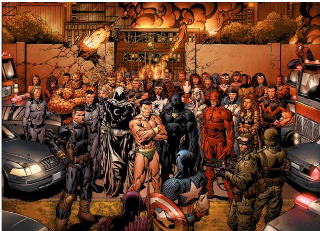
La Destruction du manoir des Avengers © MARVEL

INAUGURÉE LE 18 SEPTEMBRE AU 48 RUE VICTOR-HUGO, LA MAISON DE L'ARCHITECTURE DE NORMANDIE-LE FORUM (MAN) FRAPPE D'ENTRÉE TRÈS FORT AVEC UNE EXPOSITION OÙ LES SUPER-HÉROS DÉVOILENT LEUR VILLE.