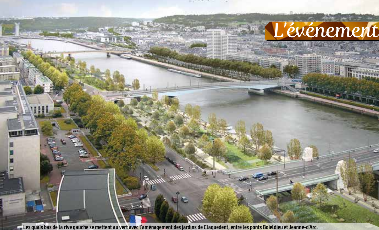
Les quais bas de la rive gauche se mettent au vert avec l'aménagement des jardins de Claquedent, entre les ponts Boieldieu et Jeanne-d'Arc.