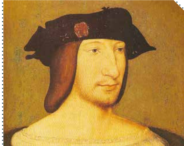
François I er