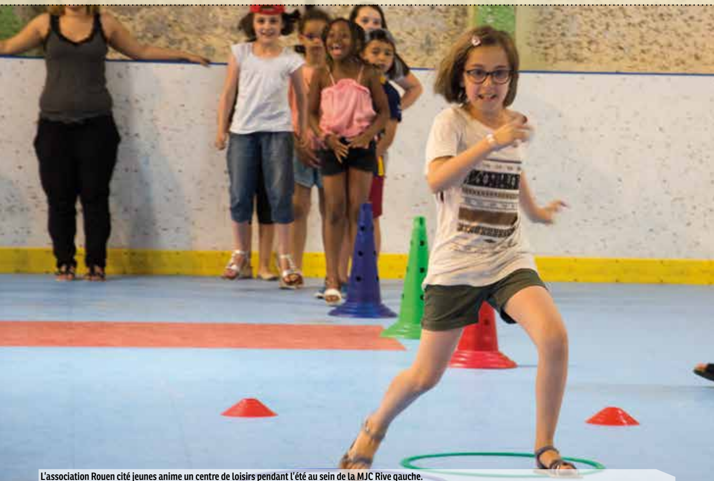
L'association Rouen cité jeunes anime un centre de loisirs pendant l'été au sein de la MJC Rive gauche.