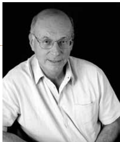
Le neuropsychiatre Boris Cyrulnik revient sur le « héros » dans son dernier livre paru chez Albin Michel, faisant écho ainsi aussi aux actes de terrorisme. Lundi 19 septembre à L'Armitière.

► les 24 et 25 septembre • Darnétal • 6 € (TR 4 €), pass 2 jours 8 € (TR 6 €)