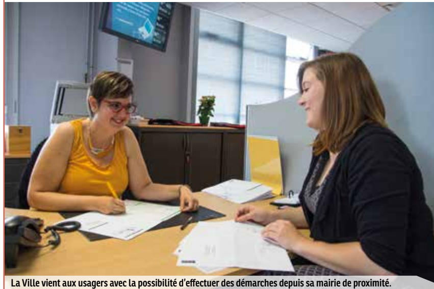
La Ville vient aux usagers avec la possibilité d'effectuer des démarches depuis sa mairie de proximité.