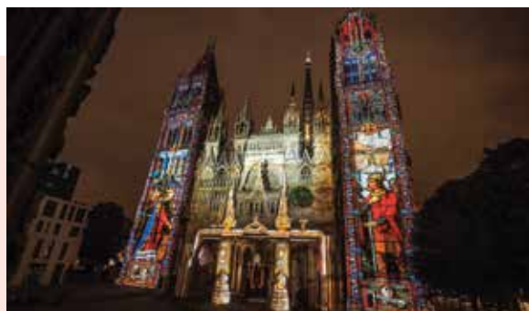
Derniers jours pour voir Cathédrale de lumière sur le parvis de Notre-Dame jusqu'au 25 septembre à 21 h 30. Accès libre.

► vendredi 23 septembre à 20 h • Maison de l'Université • Mont-Saint-Aignan • gratuit pour les étudiants