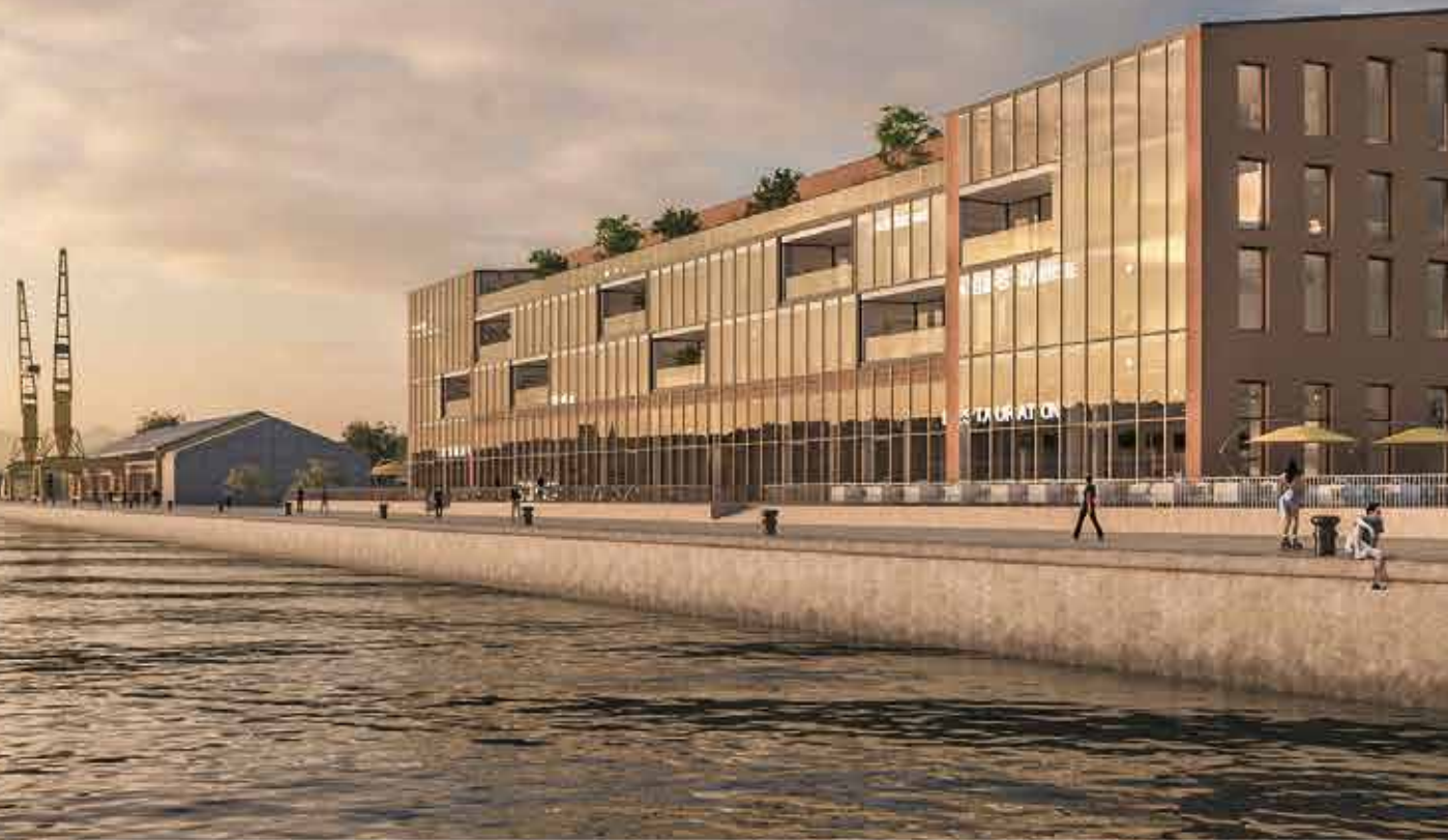
Tant côté Seine que côté « prairie » (ci-dessous), le futur hangar 107 va résolument modifier le paysage sur les quais de la rive gauche.