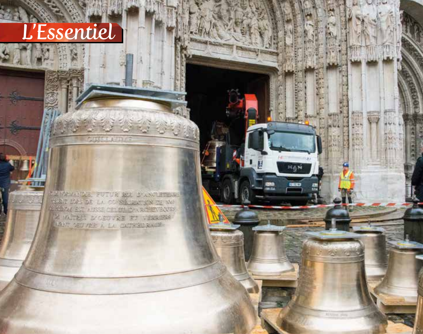
Les cloches du carillon, déplacées de la tour de Beurre à la tour Saint-Romain après leur rénovation, pour s'offrir à la visite.