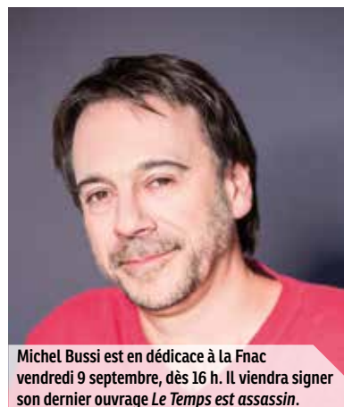
Michel Bussi est en dédicace à la Fnac vendredi 9 septembre, dès 16 h. Il viendra signer son dernier ouvrage Le Temps est assassin .

► mercredi 28 septembre à 15 h • Maison des aînés • inscr. obligatoire au 02 32 08 60 80