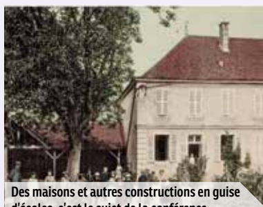
Des maisons et autres constructions en guise d'écoles, c'est le sujet de la conférence du 28 septembre au musée de l'Éducation.

► mercredi 28 septembre à 18 h • Musée national de l'Éducation, centre de ressources • entrée libre et gratuite, dans la limite des places disponibles