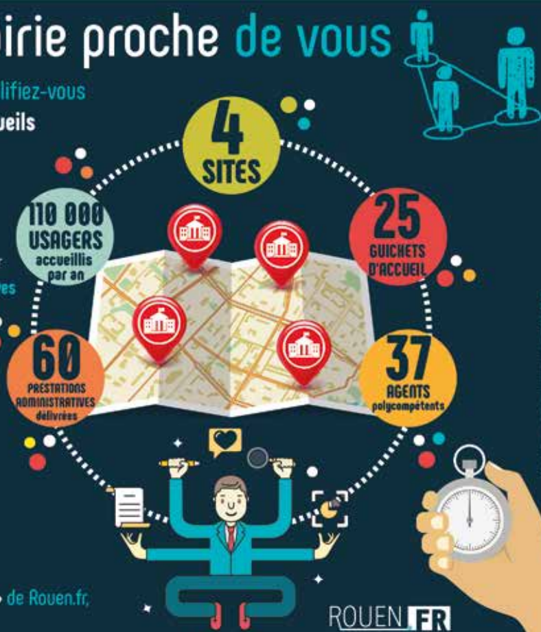
Ville de Rouen - 2017 - Le guichet unique de 2017 - 04/18

Retrouvez toutes les prestations sur le portail « service et démarches » de Rouen.fr, rubrique « démarches ».